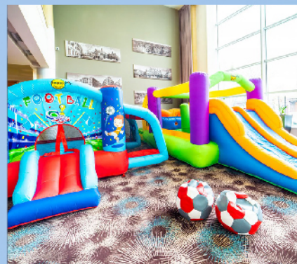
Mobilny plac zabaw dla najmłodszych