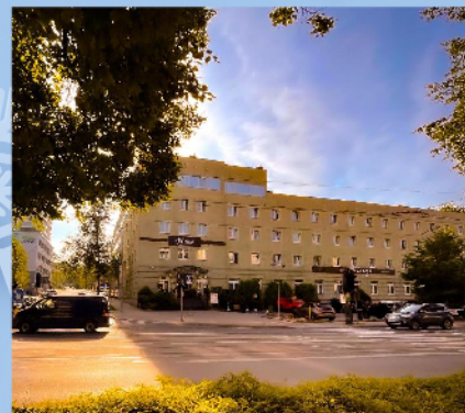
Duży parking w centrum miasta