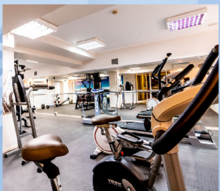
Relaks i rekreacja na miejscu w hotelu