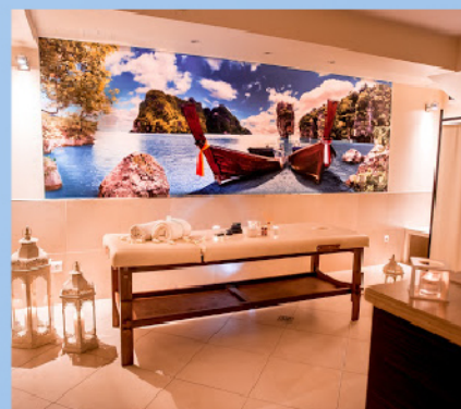
Zabiegi i masaże pielęgnujące na ciało