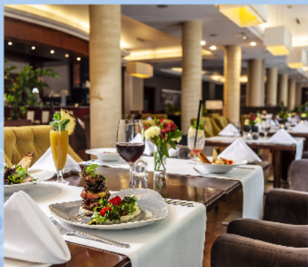
Kuchnia europejska z elementami kuchni regionalnej w centrum Olsztyna